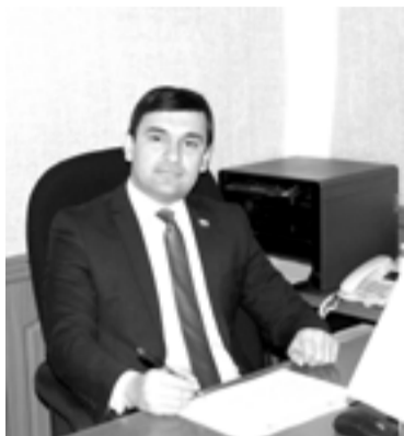
Фирӯз САЙНОЗИМЗОДА мушовири калони Кумитаи Маҷлиси намоёндагони Маҷлиси Олии ҶТ оид ба қонунгузорӣ ва ҳуқуқӣ инсон

Қонунҳои қаблан қабулгардида «Дар бораи санадҳои меъёрии ҳуқуқӣ» дар рушду нумӯи низоми ҳуқуқӣ