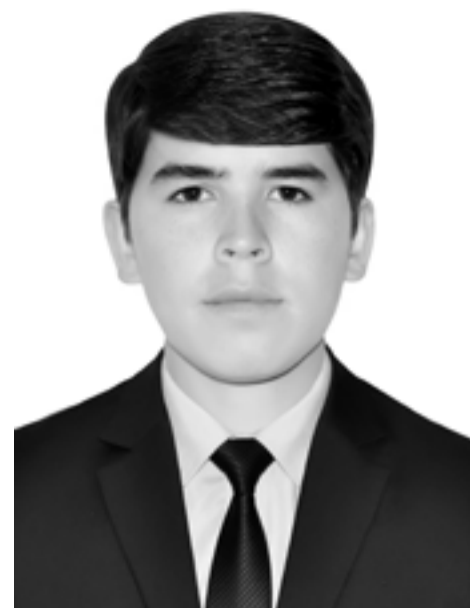
Сомон НАВРҶЗОДА донишҷӯи соли 3

Асосгузори сулҳу ваҳдати миллӣ – Пешвои миллат, Президенти Ҷумҳурии Тоҷикистон муҳтарам Эмомалӣ Раҳмон дар пешгуфтори китоби “Забони миллат – ҳастии миллат” хеле ҷаззобу воқеъбинона дарҷ намудааст, ки “танҳо забон аст, ки дар ҳама даври замон таърихи воқеъ ва ростини миллатро дар ҳифзи худ нигоҳ медорад”. Дарвоқеъ, забони модарии мо дар ҳама даври замон меҳру муҳаббати бепоёни худро барои нигоҳдорӣ ва посдории ҳастии миллат бахшидааст.