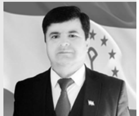
Даврон НАЗИРМАДЗОДА роҳбари дастгоҳи суди ш. Душанбе

Маҳз бо шарофати ҷидду ҷаҳд ва талошҳои пайғиронаи шабонарӯзии Асосгузори сулҳу ваҳдати миллӣ – Пешвои миллат, Президенти Ҷумҳурии Тоҷикистон муҳтарам Эмомалӣ Раҳмон