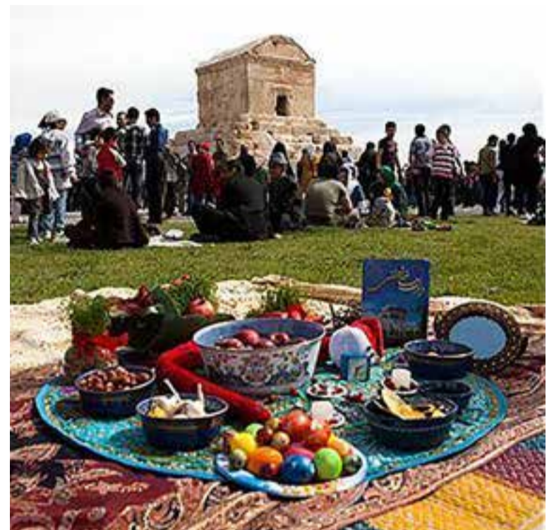
Таҷлили Наврӯз дар оромгоҳи Куруши Кабир

аввали соли 539 т.м. Наврӯзро чашни миллӣ хонд ва Эълумияро чун анъанаи неки Наврӯзӣ ба мардум тухфа намуд, ки ин ба миёнаи моҳи март-апрел рост меояд. Яъне, маълум мешавад, ки Куруш бо шарофати иди Наврӯз асиронро озод, гунаҳгоронро авф, бенавоёнро хон ва бединаронро дин додааст, ки аз амалҳои неки инсонӣ ва