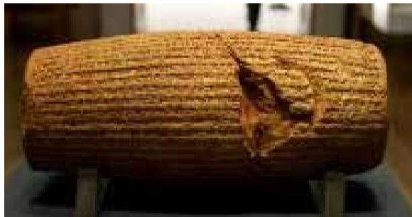
Устувонаи Куруш, ки дар он матни эълумияи ҳуқуқи башар оварда шудааст ва тибқи манобеи таърихӣ эълумияи мазкур дар арафаи Наврӯз ба мардум армуғон шудааст.

Ч о л и - би диққат он аст, ки эълони Наврӯз ҳамчун иди миллӣ ва қабули Эълумияи ҳуқуқи башари Куруши Кабир ба як рӯз рост меоянд. Куруш охири соли 538 т.м. ва аввали соли 539 т.м. Наврӯзро чашни миллӣ хонд ва Эълумияро чун анъанаи неки Наврӯзӣ ба мардум тухфа намуд, ки ин ба миёнаи моҳи март-апрел рост меояд. Яъне, маълум мешавад, ки Куруш бо шарофати иди Наврӯз асиронро озод, гунаҳгоронро авф, бенавоёнро хон ва бединаронро дин додааст, ки аз амалҳои неки инсонӣ ва