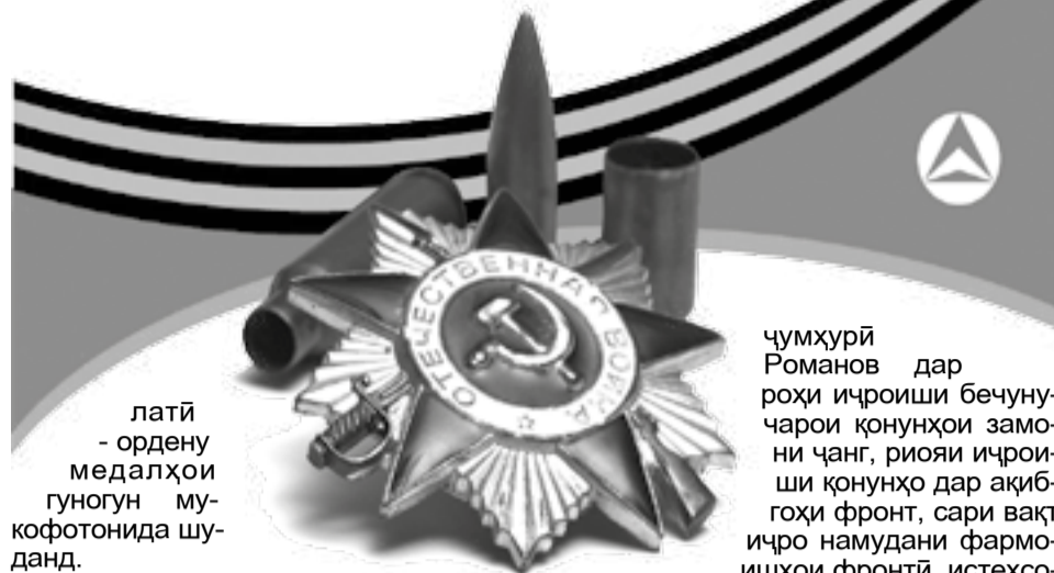
латӣ - ордену медалҳои гуногун мукофотонида шуданд.

Боиси ифтихор аст, ки мақомоти Прокуратураи Тоҷикистон чун як ҷузъи таркибии мақомоти Прокуратураи СССР дар давраи вазнини Ҷанги Бузурги Ватанӣ ва давраи барқароркунии хоҷагии халқи мамлакат дар роҳи таъмини риояи иҷроиши қонунҳои замони ҷанг ва давраи баъдиҷангӣ хизмати босазои худро анҷом додааст. Дар ин давра мақомоти прокуратураи Тоҷикистон тахти роҳбарии прокурори вақти