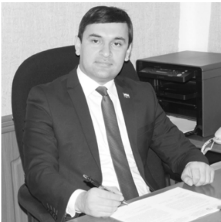
Фирӯз САЙНОЗИМЗОДА мушовири калони Кумитаи Маҷлиси намояндагони Маҷлиси Олии ҶТ оид ба қонунгузорӣ ва ҳуқуқи инсон

ба талаботе, ки дар бозори байналмилалӣ меҳнат пешниҳод карда мешаванд, пайваста чораҳои мақсаднок меандешанд. Дар иртибот ба ин, дар кишварамон як қатор санадҳои меъёрии ҳуқуқӣ, барномаҳо, концепсияҳо, қарорҳо ва стратегияҳо қабул карда шуданд.